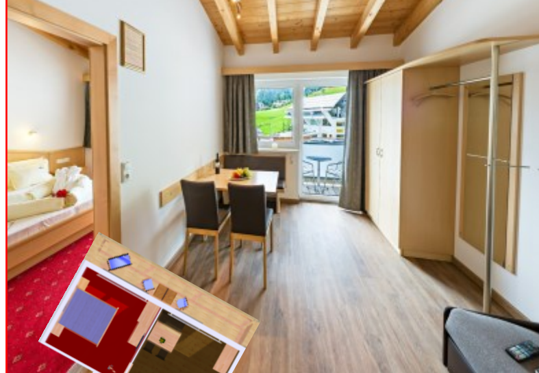
Wohnbeispiel Apartements 2-4 Personen