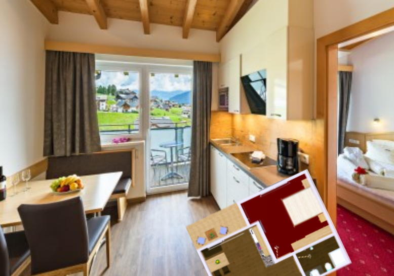
Wohnbeispiel Apartements 2-4 Personen