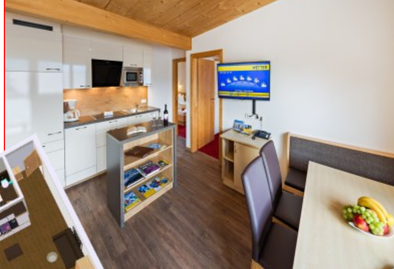
Wohnbeispiel Apartments 4-6 Personen