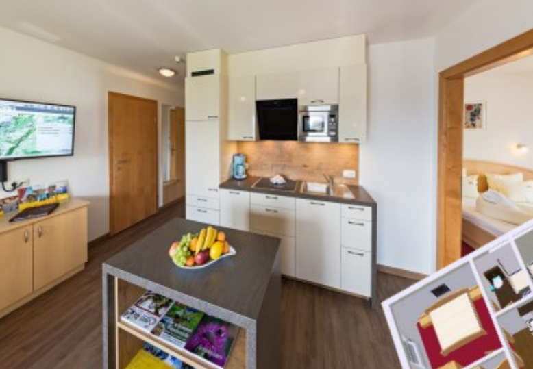
Wohnbeispiel Apartments 4-6 Personen